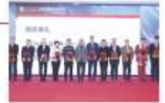
CHARMING | 21