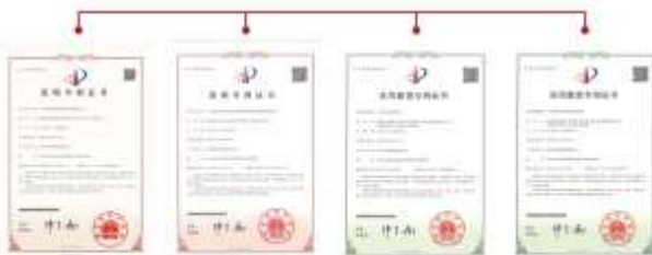
22 | CHARMING