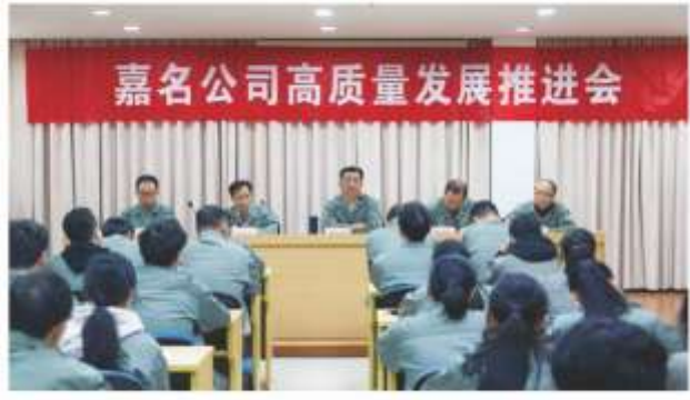
20 | CHARMING